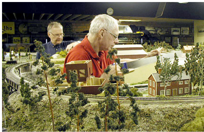
Den gamla hyttan (studiemodell) ställs åt sidan ... och den nya modellens grundplatta passas in i landskapet.