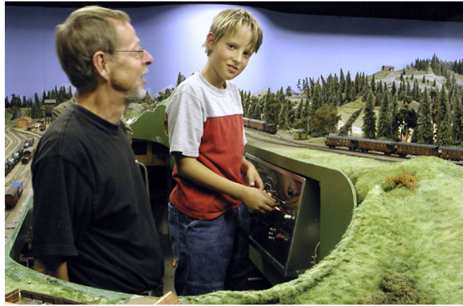
Ett tågklarerarbiträrade under sin tjänsteutövning på station Kolaråsen.