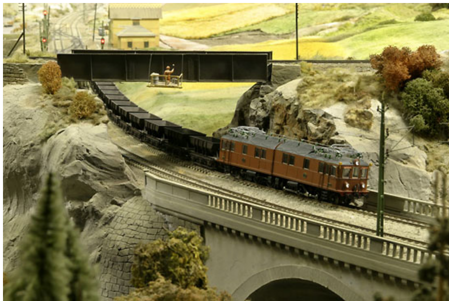
Serieprototypen till SMJ:s färdigbyggda lok litt Oa på jungfrufärd.

Nu skall ingen ta detta med 'veckans' alltför strikt, det blir vad det blir. Det är tillfället och möjligheten som gör när en uppdatering kommer men med ungefär så där nån veckas mellanrum så försöker vi byta ut bilden.