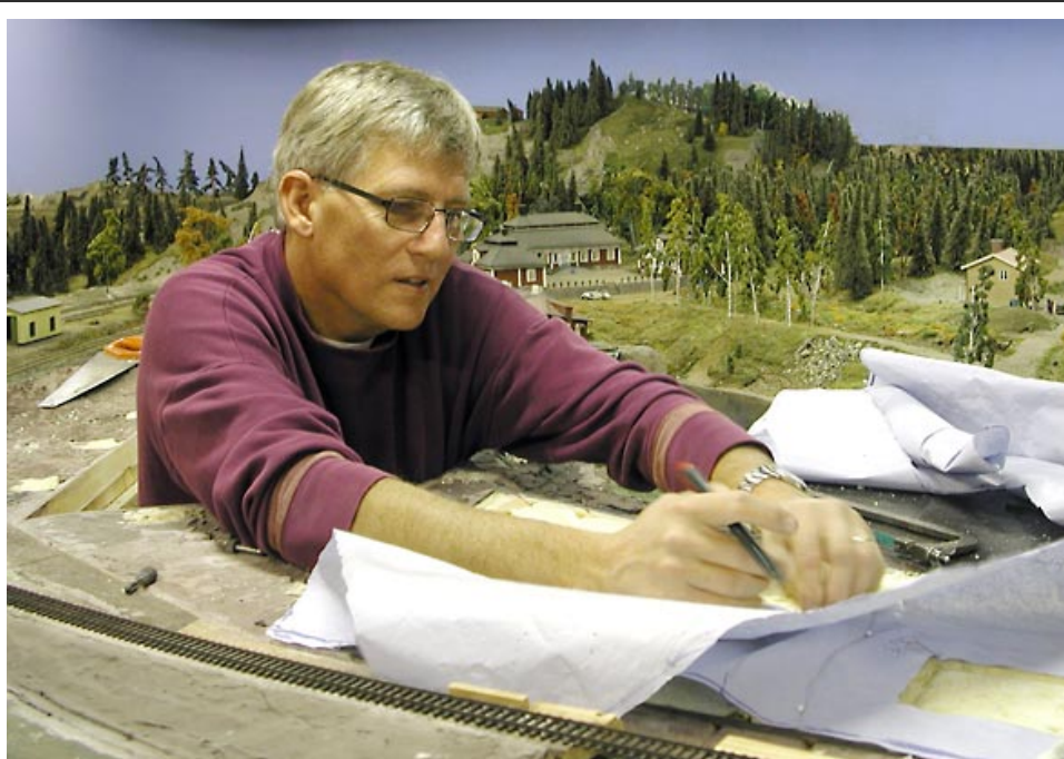
Bångfors samhälle får sin nya gatuplan efter omregleringen.