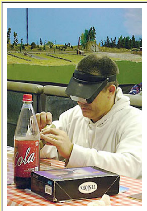
Man har ju hört talas om Cola för IT-programmerare, men här kanske det är en hemlig ingrediens för målningen?