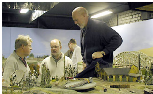
Pizza för den ihärdige arbetaren? Aha, byte av vändskivan i Mohällarne. Vi får väl återkomma med en ny bild när det är klart om någon månad eller två ...