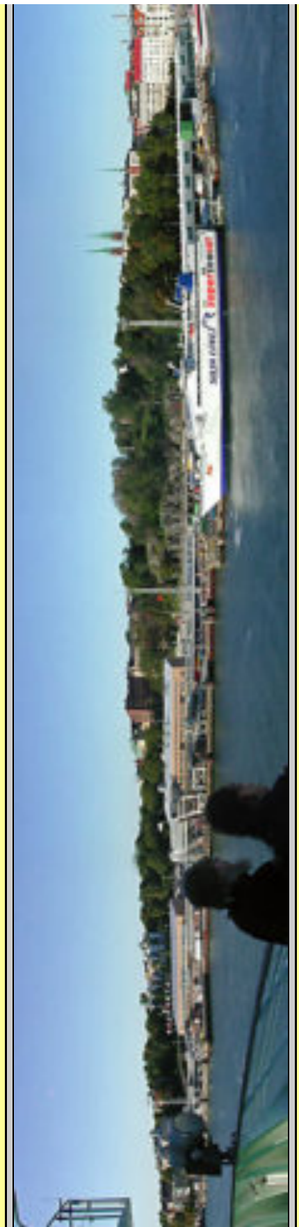
Den mycket vackra hamnbassängen