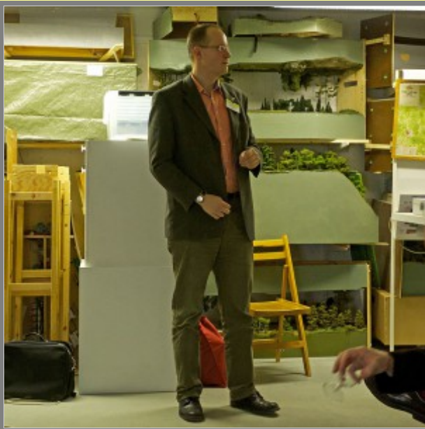
Låt mig presentera