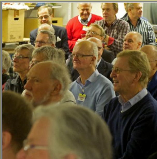
Äntligen litet riktig info