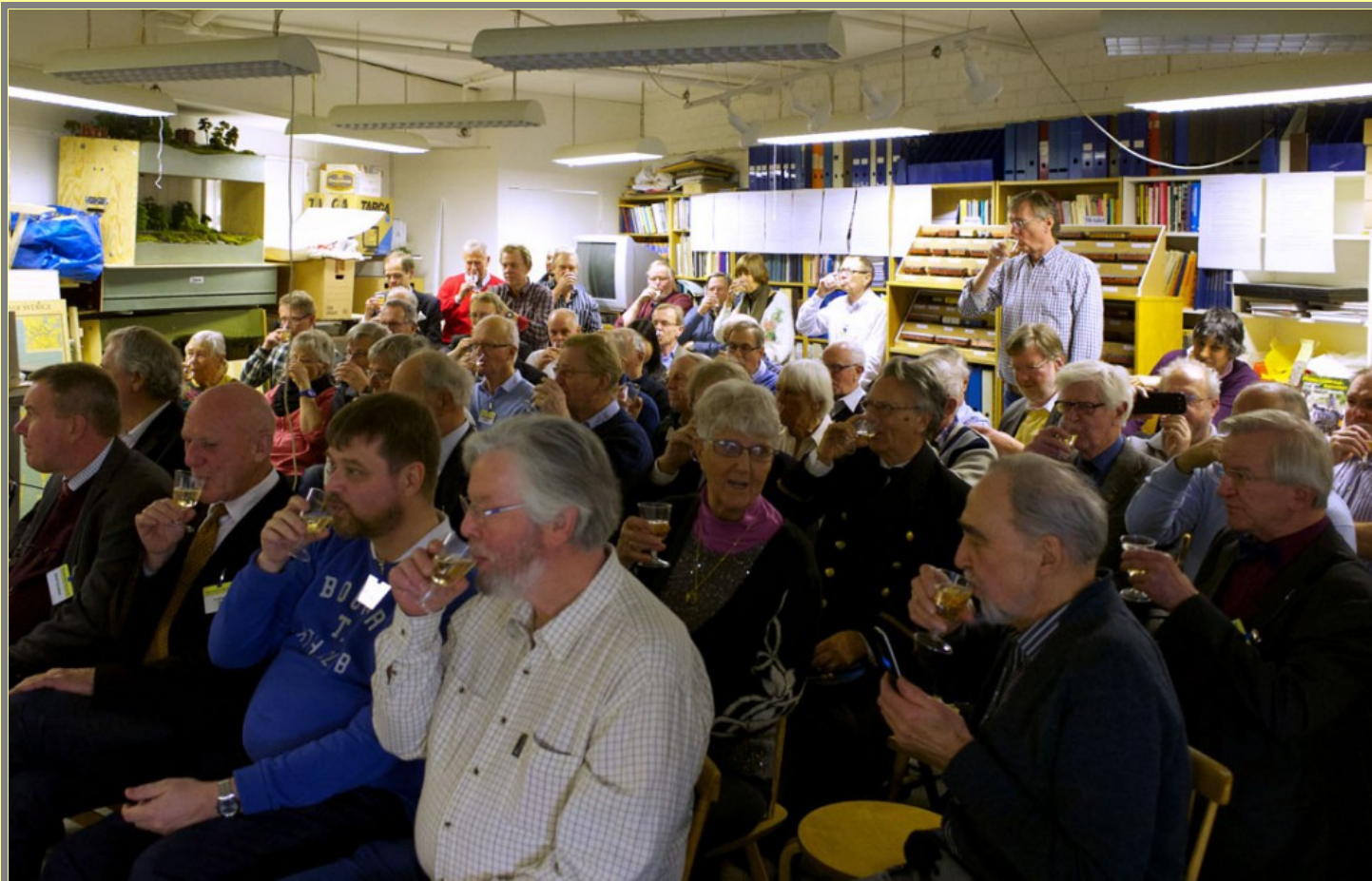
Trångt och glatt i klubblokalen

SMJ:s 75-årsdag fortsatte med champagne, föredrag av olika slag, tårta, kaffe och avec i klubblokalen. Alla lyssnade väl och lät sig lät sig väl smaka.