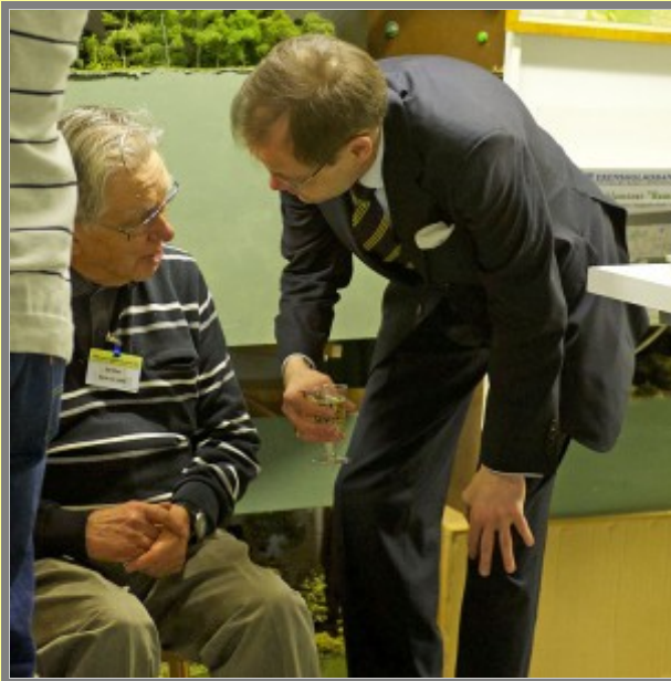
Jag tar hand om stämningarna sedan