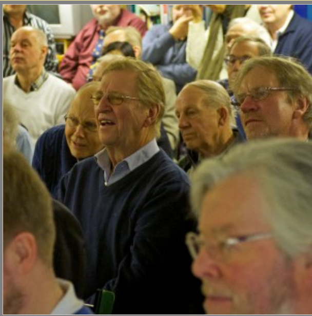
Vi vill ha mera