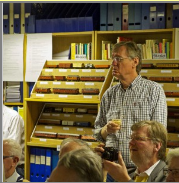
Ska det här vara kul?