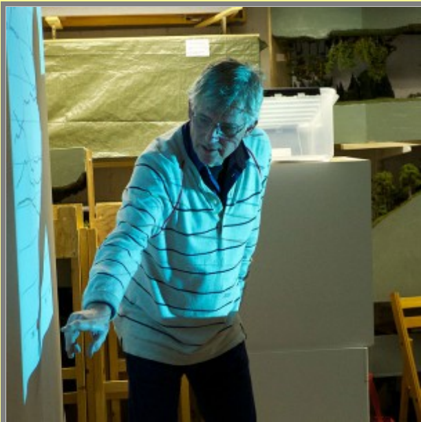
Vi kommer att sjunka dit