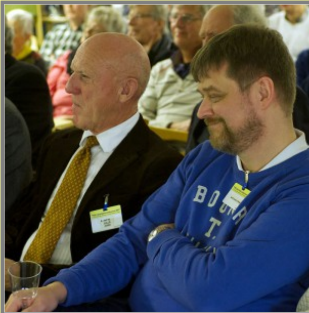
För litet DCC