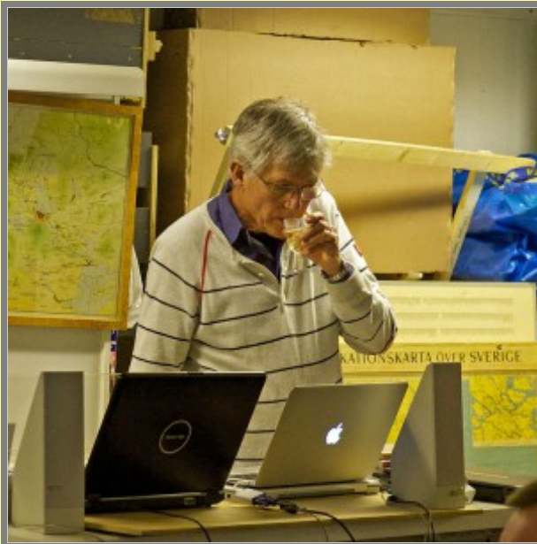
Nu blir det multimedia