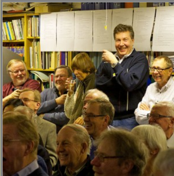
Nu har det roliga börjat