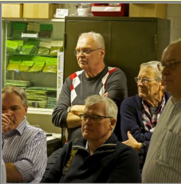
Ska man tro allt han säger?