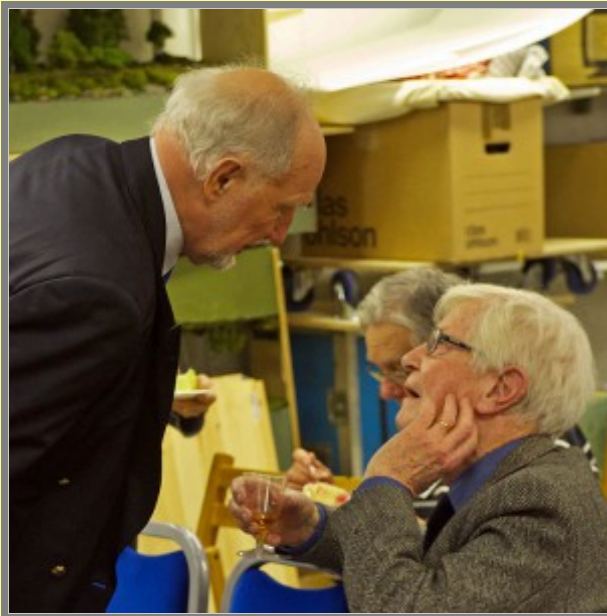
Va sa' du?