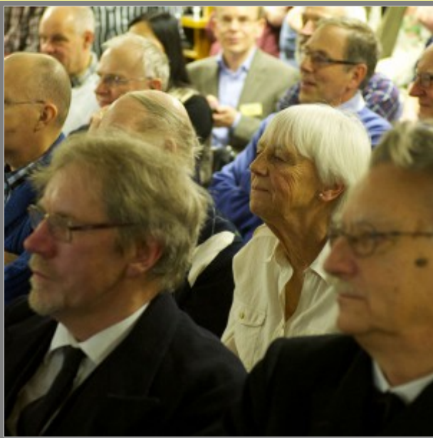
Så många gubbar