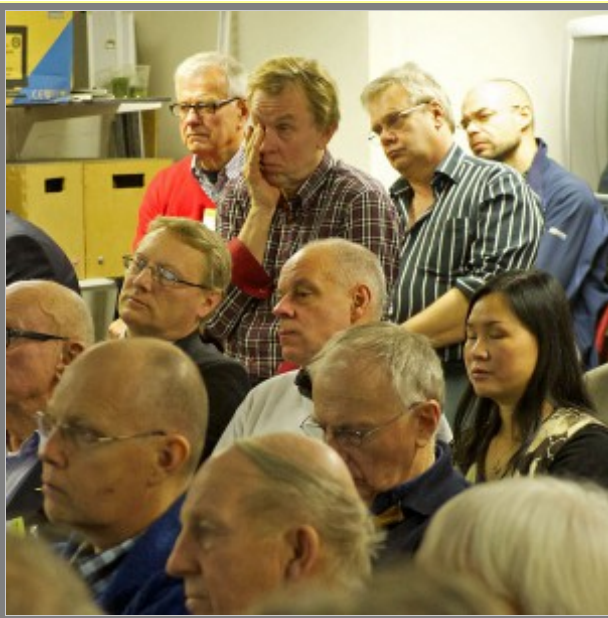
Är det här kul...