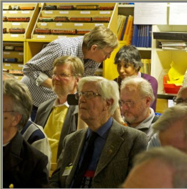
Jag förklarar litet senare