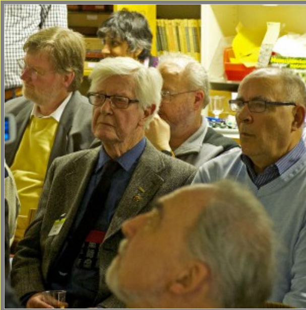
Det var bättre förr