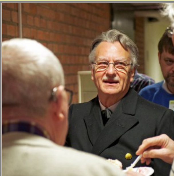
Ordning och reda