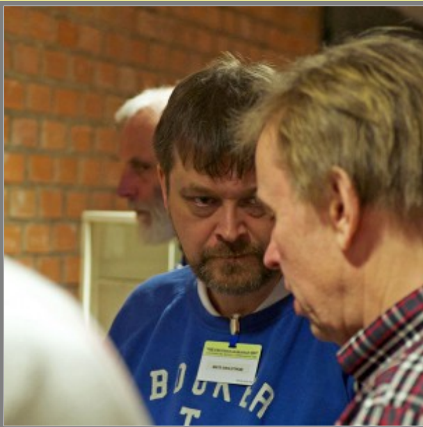
Ska du inte ha ljud?