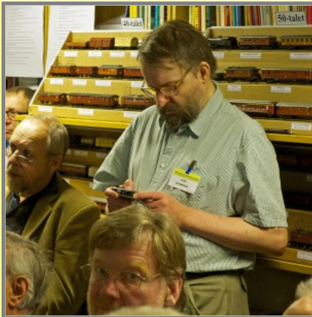
Ser bra ut