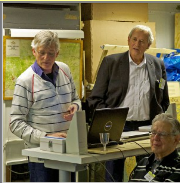
Nu ska ni få litet 50-tal