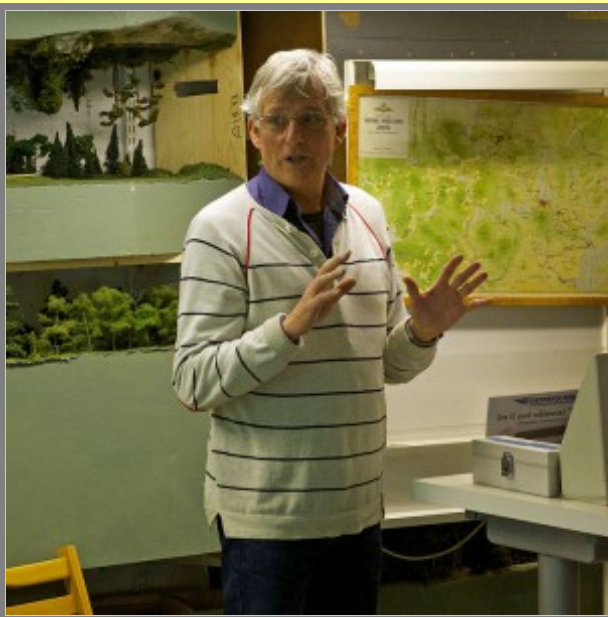
Solkart, eller hur?