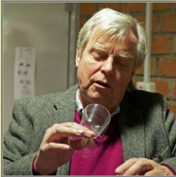
Är det verkligen slut nu?