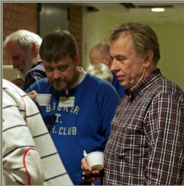
Gu' va' han tjarar