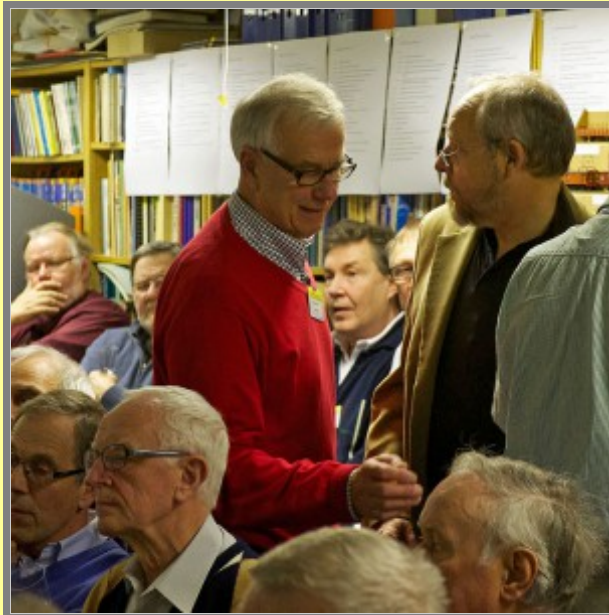
Jag ger upp