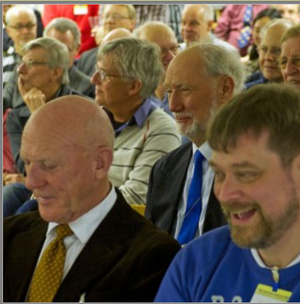
Där ser ni att jag hade rätt