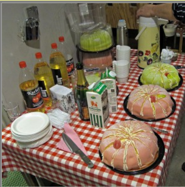
Tårtor på rad