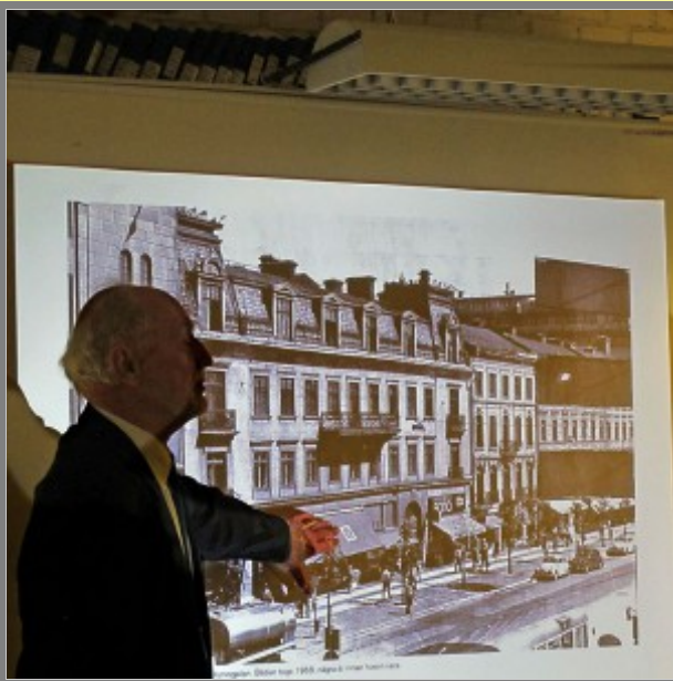
Första klubbhanan låg här