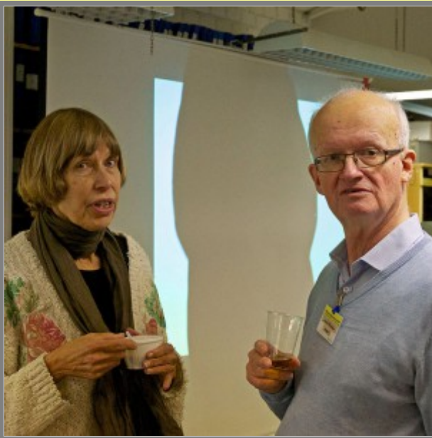
Är du säker på det?