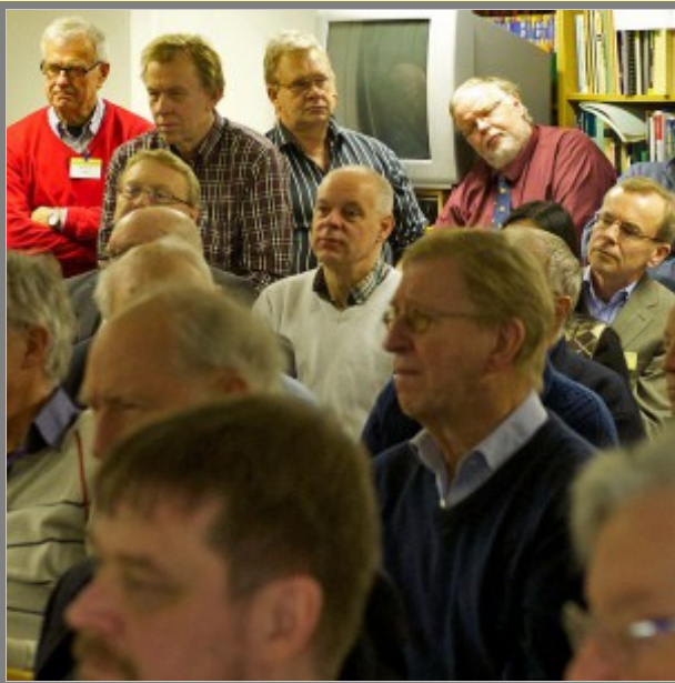
För litet mässing