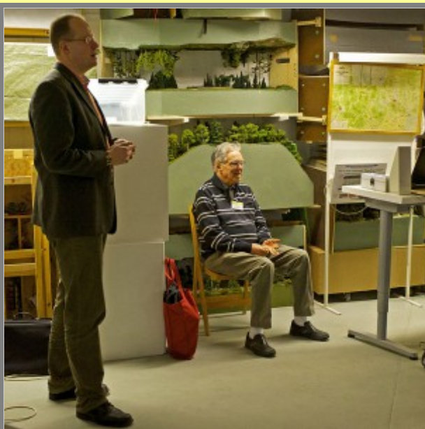
Nu börjar det på riktigt