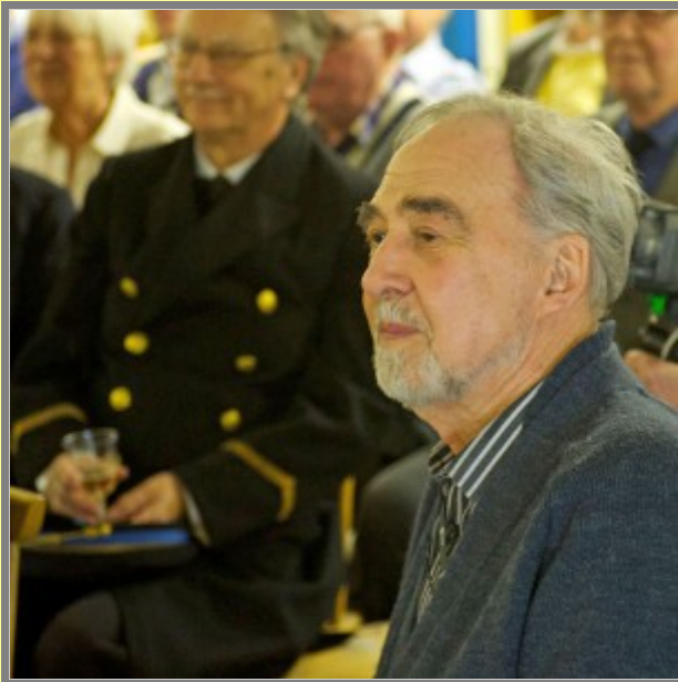
De' e' bara och njuta