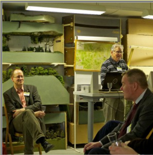
Det trodde ni inte, va?