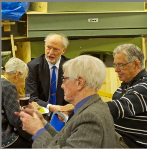
Ska vi starta en ungdomssektion?