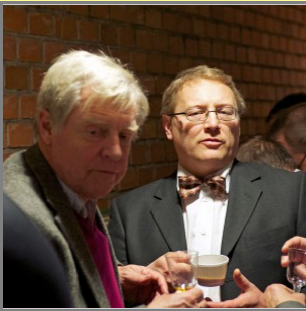
Det ska vara moduler tycker jag