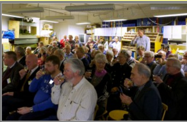
Nu kan de börja //