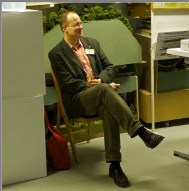
Nu är ni väl nöjda