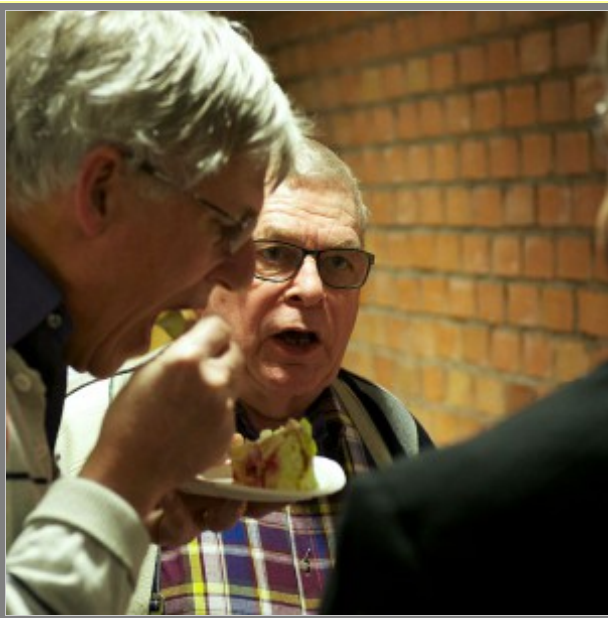
Får man inte mer tårta?