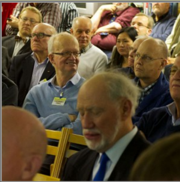
Kan man få påfyllning?