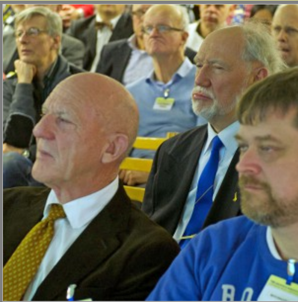
Vad sa han nu?