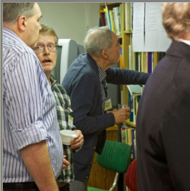
Är du helt säker?!